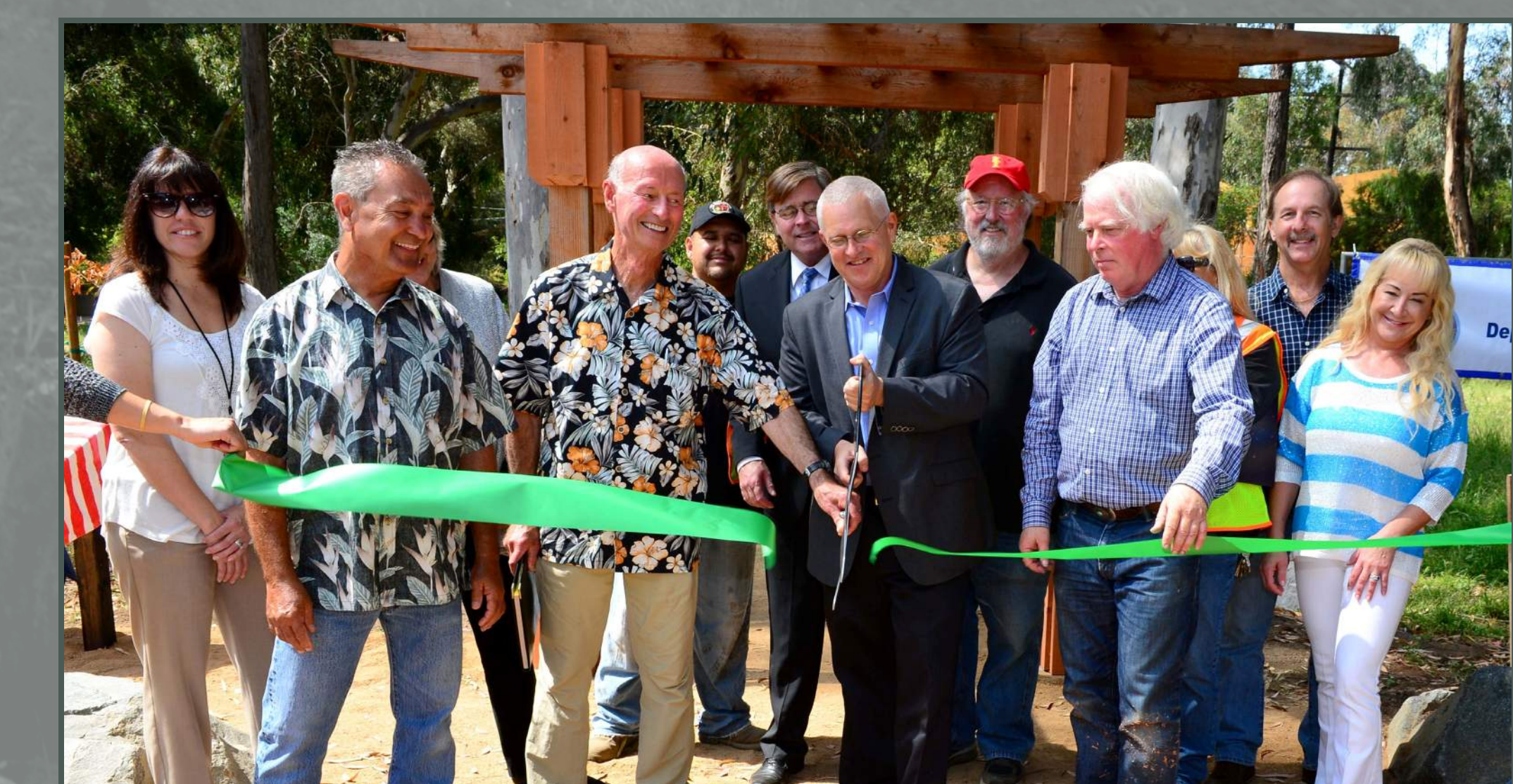
Rehabilitation of historic Eucalyptus Grove, Rustic Canyon Recreation Center