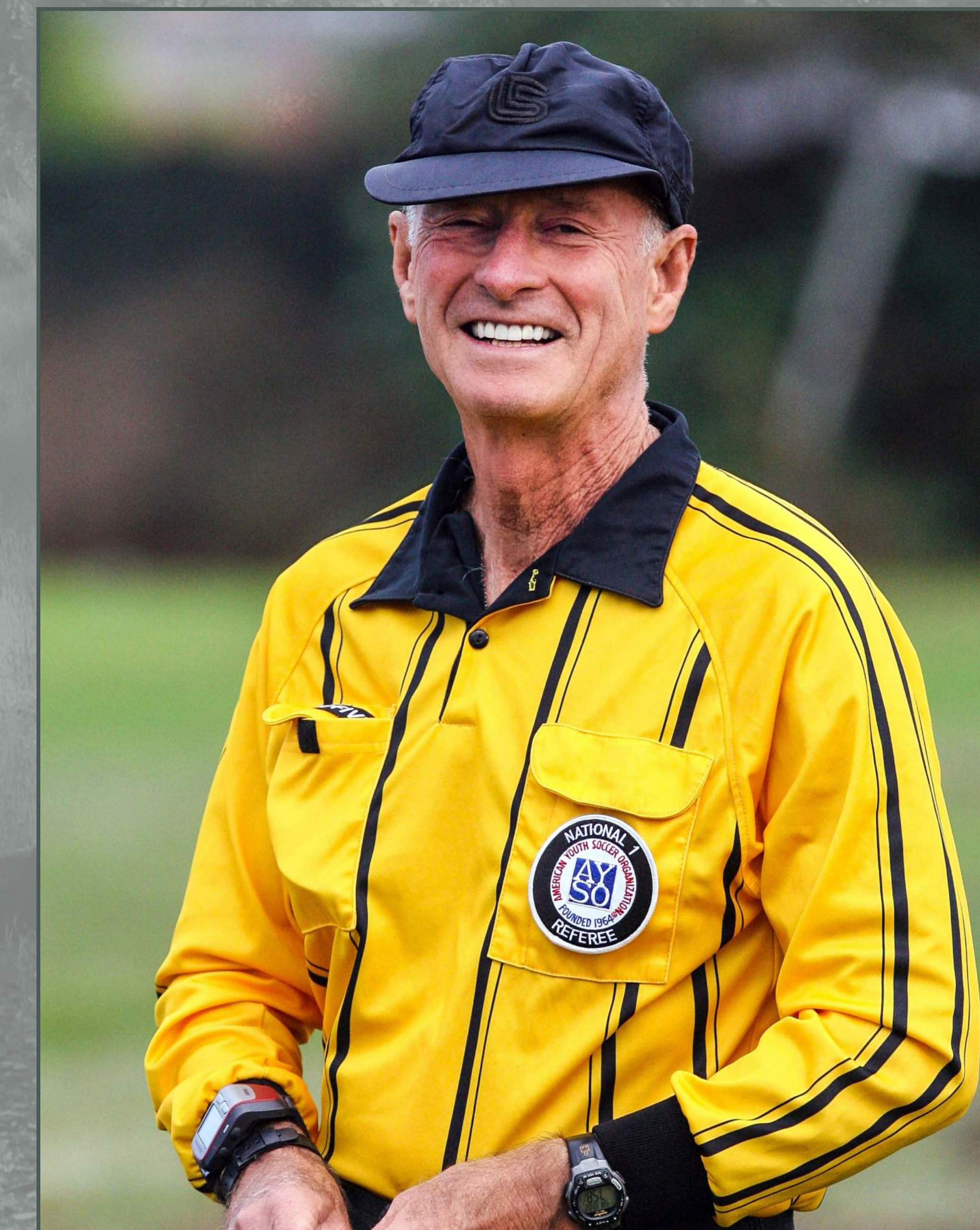
Nationally certified, George refereed thousands of games in the Palisades area.